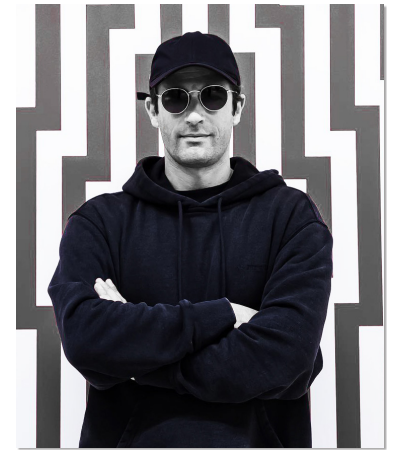
Instagram : @latlas_art Website : www.latlas-art.org