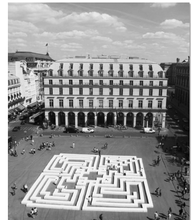
Toulouse | 2016